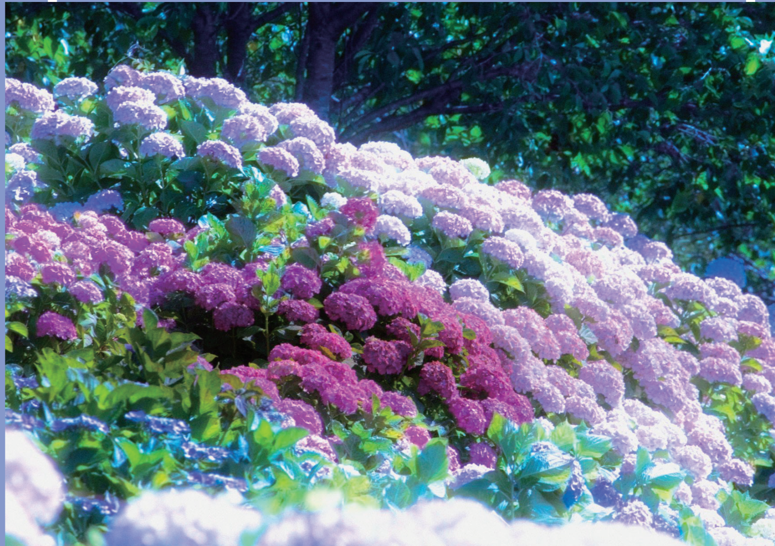
のいちあじさい街道